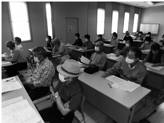
昨年度うおい館での講座の様子